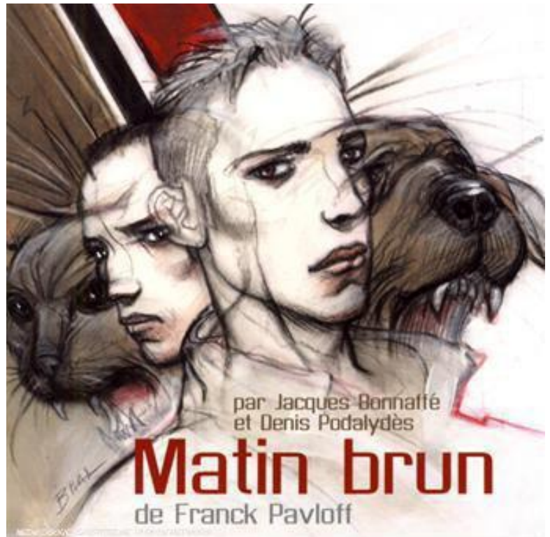
Pochette du CD audio du livre