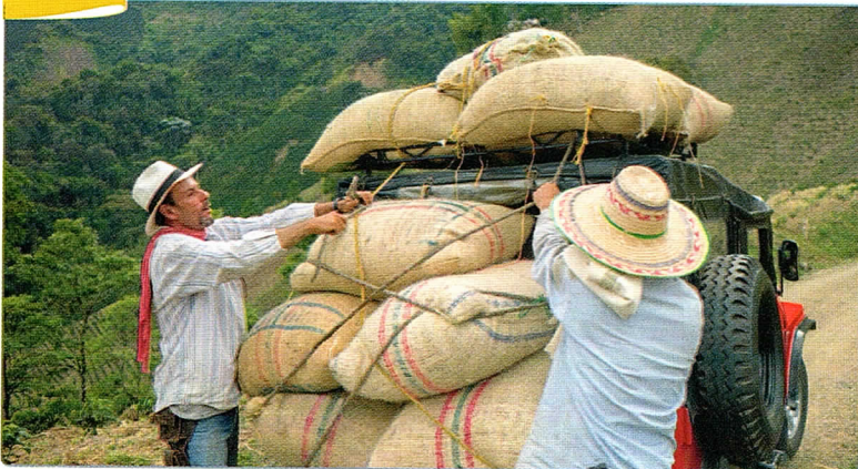
Doc. 1 Le transport du café depuis une ferme en Colombie

On distingue les flux matériels , c'est-à-dire les flux de marchandises ou de matières premières, des flux immatériels , c'est-à-dire les flux de services, de capitaux et d'informations.