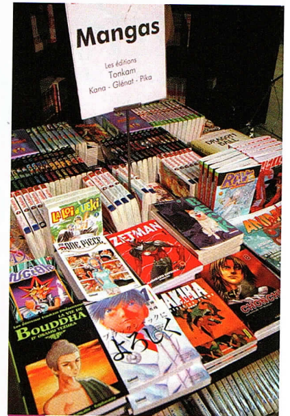
2 La diffusion des manga .

Les manga et leurs produits dérivés connaissent un succès planétaire.