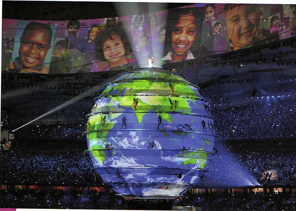
1 La cérémonie d'ouverture des Jeux Olympiques de Pékin en 2008.

Aujourd'hui, de grandes entreprises diffusent les mêmes produits dans le monde entier. On assiste ainsi au rapprochement des modes de vie et à la naissance d'une culture mondiale.